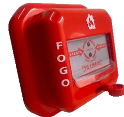
Versão Embutida Com ADAPT-Q