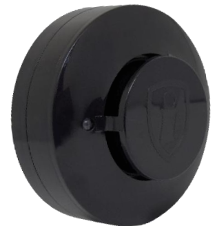
Modelo opcional na cor preto