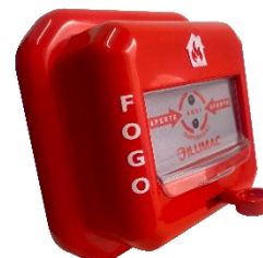
Versão Embutida Com ADAPT-Q